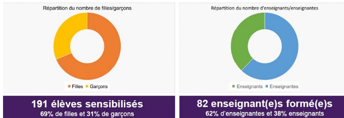
Figure 03 : Les résultats de la caravane RELIEFH

Dans son premier parcours, la Caravane a parcouru plus de 680 km pour visiter cinq villes du Sénégal (Diannadio, Fatick, Tambacounda, Kolda et Ziguinchor). Chaque étape a été l'occasion de rencontrer les élèves - filles et garçons - et le corps enseignant d'une école pour les sensibiliser à l'importance de la scolarisation des filles. Des médias locaux sont mobilisés pour médiatiser l'évènement en vue de sensibiliser et promouvoir davantage les résultats obtenus et préparer les perspectives de l'initiative.