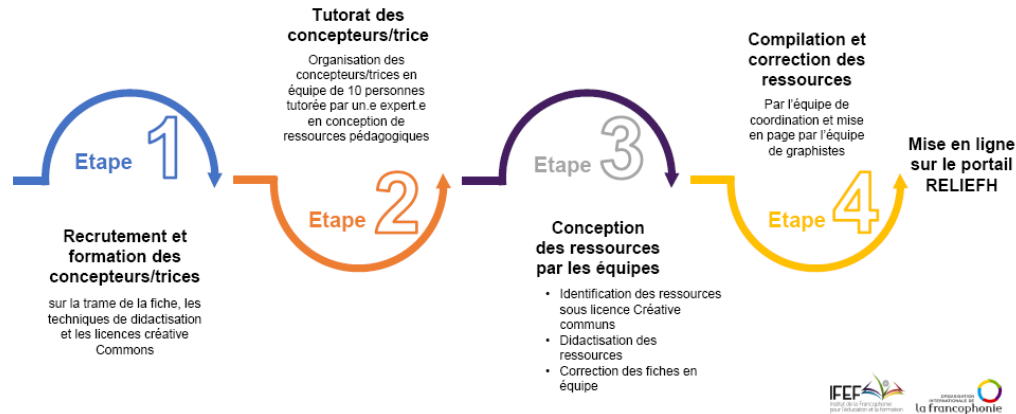
Figure 02 : Processus de production de REL EFH

Des tutoriels et supports de formation dédiés à ces opérations de formation/production sont accessibles librement aux inscrits sur la plate-forme pédagogique ( EDUNAO ) de l'IFEF.